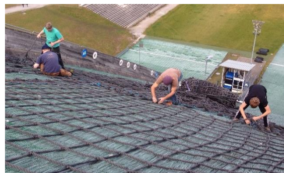
Netze montieren auf der HS89

Neben all diesen Sanierungsarbeiten konnten wir uns auch wieder auf zahlreiche Eltern, sowohl beim Abbauen der Netze im Frühjahr, als auch beim Montieren im Herbst, verlassen. Hier helfen alle immer wieder zusammen in der Abteilung. Es ist schön gemeinsam solche Arbeitseinsätze zu meistern, um unseren Kindern das Skispringen das ganze Jahr über zu ermöglichen.