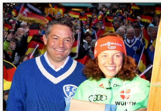
Empfang von Laura Dahlmeier am 09.04.2016

Ich traue mich zu behaupten, dass ein Großteil der Eltern unserer Sportler den enormen Aufwand im Nachwuchsbereich sehr schätzen und deshalb auch bereit sind, die zahlreichen Veranstaltungen tatkräftig zu unterstützen.