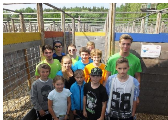
Gemeinsam durchs Labyrinth und Aufgaben lösen

Da wie erwähnt der Saisonstart bei uns wegen Sauerungsarbeiten verzögert war, wichen wir zunächst auf Natters bei Innsbruck aus. Als dann der G7 Gipfel im Land war, haben wir uns gleich ganz aus dem Staub gemacht. Es wurde ein sehr wertvoller Ausweichlehrgang im Fichtelgebirge, in Bischofsgrün, absolviert. Neben dem reinen Sprung- und Inlinetraining wurde in einem Labyrinth auch etwas für das Gemeinschaftsgefühl und die Konzentrationsfähigkeit getan. Es wurde auch mal im Jogging- oder Langlaufanzug gesprungen, um das Fluggefühl zu schulen. Ein Kurs, der sehr viel Anpassungsfähigkeit von den Sportlern abverlangte.