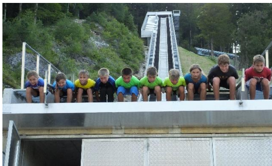
Anfahrthocke am Schanzentisch der Flugschanze

Bei Besichtigung der 8. Schanze vor Ort, der Skiflugschanze kamen die einen ins Träumen, wann es denn endlich so weit ist und wie weit es dann geht, die anderen bekamen doch noch weiche Knie als wir Imitationen am Schanzentisch des Ungetüms machten.