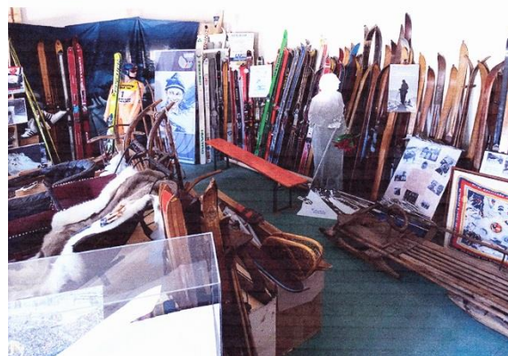
Blick auf einen Teilbereich des vereinseigenen, umfangreichen historischen Wintersportfundus (Depot) im Skistadion, Osttor

Auch wurde die Spurenbau-Firma Peter Riedel entspr. kontaktiert wg. eines Schnittmodells der Anlaufspur ebenfalls für den Depotfundus des Clubs, was dto. kostenfrei zugesagt wurde.