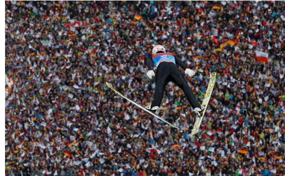
Severin Freund zieht die Massen nach Partenkirchen