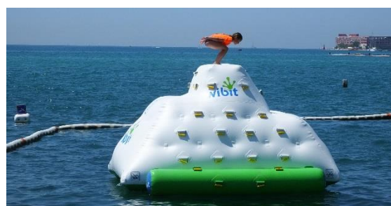
Ganz ohne Schnee können wir selbst am Meer nicht