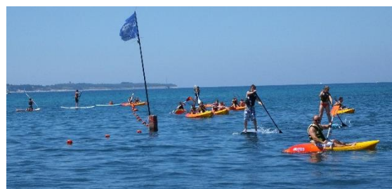
Beim Ausgleichstraining in Portoroz

Der große SCP Sommerkurs führte uns dieses Jahr in die wohl modernste Trainingsstätte die das Skispringen derzeit weltweit zu bieten hat. Planica (SLO) hat mit sage und schreibe sieben (7) neue Mattenschanzen alles zu bieten, was man sich nur erträumen kann. Die enge Abstufung zwischen den Schanzen hat fast allen Athleten die Möglichkeit geboten mal auf eine etwas größere Schanze zu gehen, als normal. Auch wenn es zunächst viel Überwindung kostet, waren alle enorm stolz diese Herausforderung gemeistert zu haben. Dabei purzelten die inoffiziellen persönlichen Rekorde natürlich am laufenden Band. Um diese Trainingswoche etwas aufzulockern, machten wir auch einen Ausflug nach Portoroz ans Meer. Hier wurde jedoch nicht nur Sonne getankt, sondern mit Kajak fahren, Stand Up Paddeln und Hindernisparcours am Wasser richtig trainiert.