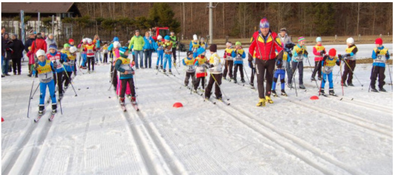
Clubmeisterschaft, Start der Klassen bis U9