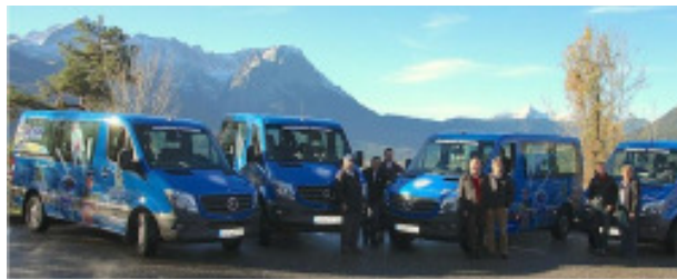
Neue Mercedes Sprinter der SCP-Flotte

Außerdem wurden im Oktober und November 2013 vier neue Mercedes Sprinter, darunter ein Allradfahrzeug angeschafft.