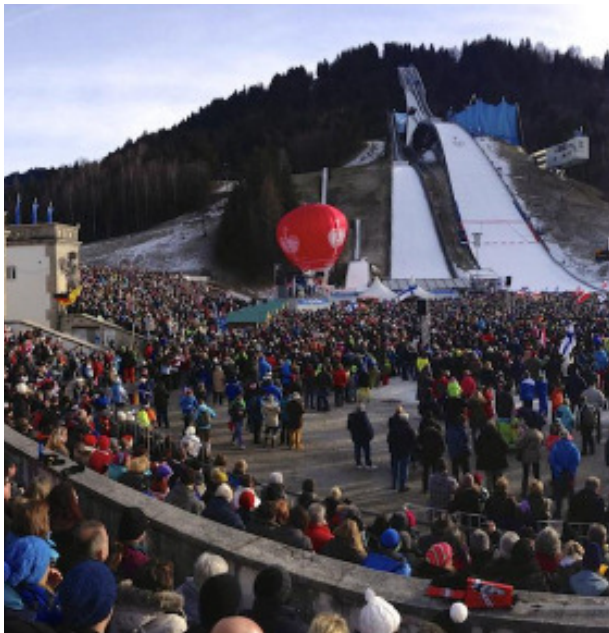
Volles Haus im Olympia-Skistadion

Volles Haus stimmt voll zufrieden: Das Fazit des Neujahrsskispringens war sehr positiv. Ein neues Animationsprogramm, stellten die Crowd Supporters aus Polen dar. Sie tanzten und hüpfen über die Bühne und animierten in Après-Ski-Manier das Publikum. Die Sprachbarrieren gingen ein wenig zu Lasten des Unterhaltungswertes, deshalb werden für das nächste Jahr diverse Alternativen ins Auge gefasst.