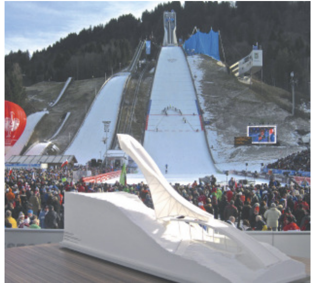
Das Modell unserer Schanze wurde auf der ZDF-Presenter-Position gut in Szene gesetzt