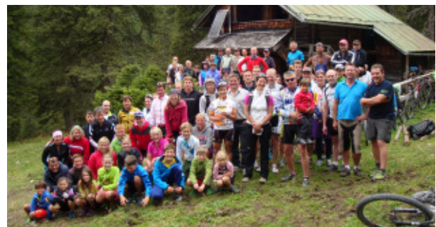
Teilnehmer beim Toni-Fedl-Gedächtnis-MTB