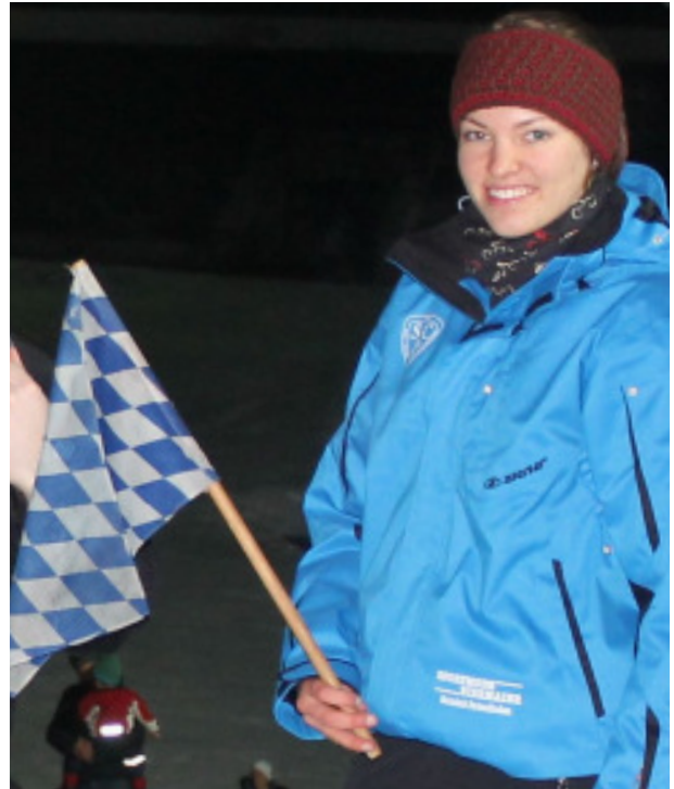
Jojo bei den Nordischen Nächten

Jedoch bin ich nicht nur in der Geschäftsstelle eingebunden, sondern auch beim Training mit den Skispringern und Kombinierern. Dazu gehört neben dem alltäglichen Training auch Skiwachsen und Wettkampfbetreuung in ganz Deutschland, das