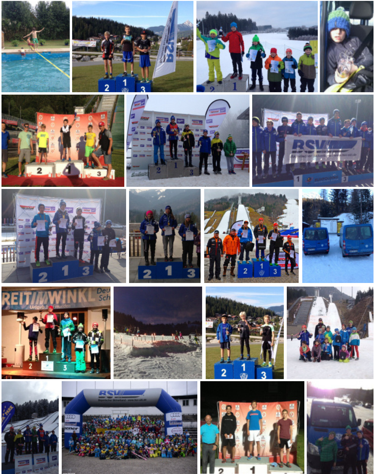
Impressionen Skisprung / Nord. Kombination 2013/2014

Sportwart und Trainer Skisprung / Nordische Kombination