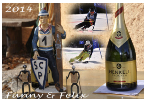
Die diesjährigen Clubmeister 2014