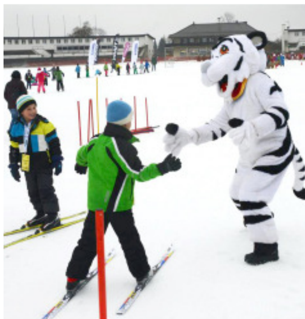
Schulaktionstag „Auf die Plätze fertig Ski“

Im Versuch, dass regionale Skiclubs näher zusammenrücken und gemeinsam den Langlaufnachwuchs und -rennsport fördern, um dadurch Kinder für den Sport zu begeistern, wurden die Nordischen Nächte im Skistadion auch den umliegenden Skiclubs angeboten. Leider hat unser Gedanke bei vielen Clubs keinen Zuspruch gefunden, lediglich der SC Peiting ist mit seinen Kindern dabei gewesen. Die Nordischen Nächte waren aber durchaus für unseren Club ein großer Erfolg. 30 bis 50 Kinder fanden sich beim Langlaufen, Spielen und Ski-springen im Olympia-Skistadion, während die Eltern bei Glühwein und Würscht'l-Semmel plauderten.