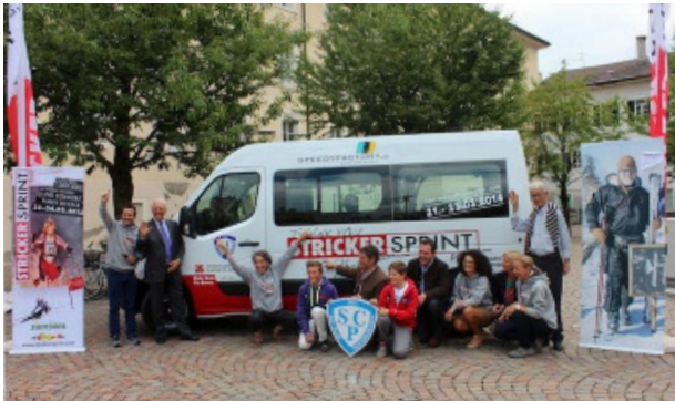
Sieger-Bus vom Stricker-Sprint

Der beim Stricker-Sprint in Brixen/Südtirol im März 2013 gewonnene Renault-Bus wurde im Herbst ausgeliefert und am 11.09.2013 in Betrieb genommen.